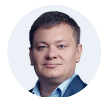
НИКОЛАЙ ПОЖИДАЕВ Президент «Ситроникс»