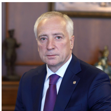
Приветствие Губернатора Томской области В.В. Мазура